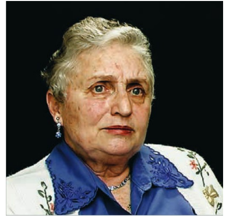
Standbild aus dem Interview, Israel 2000