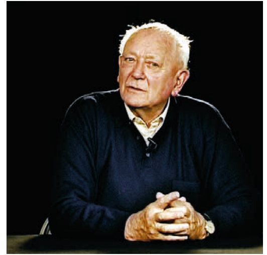
Standbild aus dem Interview, Deutschland 2004